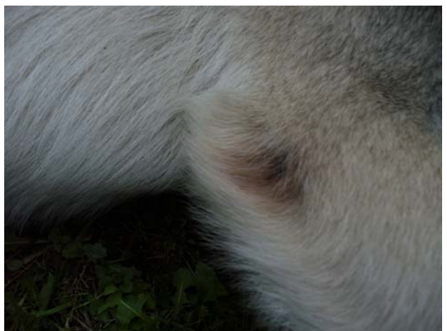
Liegeschwiele rechts 0,7 cm am 26.10.2009