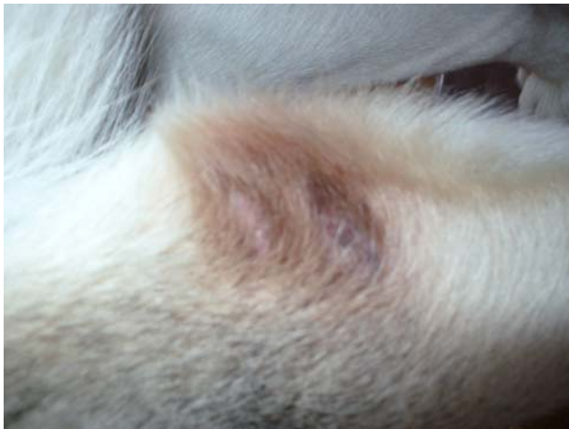
Abb. 1: Liegeschwiele links (2 Flächen: groß: 1cm, klein 0,5 cm) am 7.7.2009

Nachdem die linke Liegeschwiele allmählich zu einem größeren Problem wurde, weil Navin begann sie aufzubeissen (Abb. 1) und der Rest meines erworbenen Futters ohnehin verbraucht war, stieg ich im Juli 2009 wieder auf das von Manfred verwendete Produkt um.