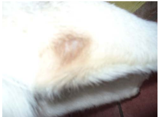
Liegeschwiele rechts 1,5 cm am 7.7.2009

In den folgenden Monaten konnte ich mich davon überzeugen, dass das richtige Futter Wirkung zeigte. Die betroffene Fläche verringerte sich auf beiden Seiten um die Hälfte in den kommenden 3 Monaten seit der Ernährungsumstellung (Abb. 2).